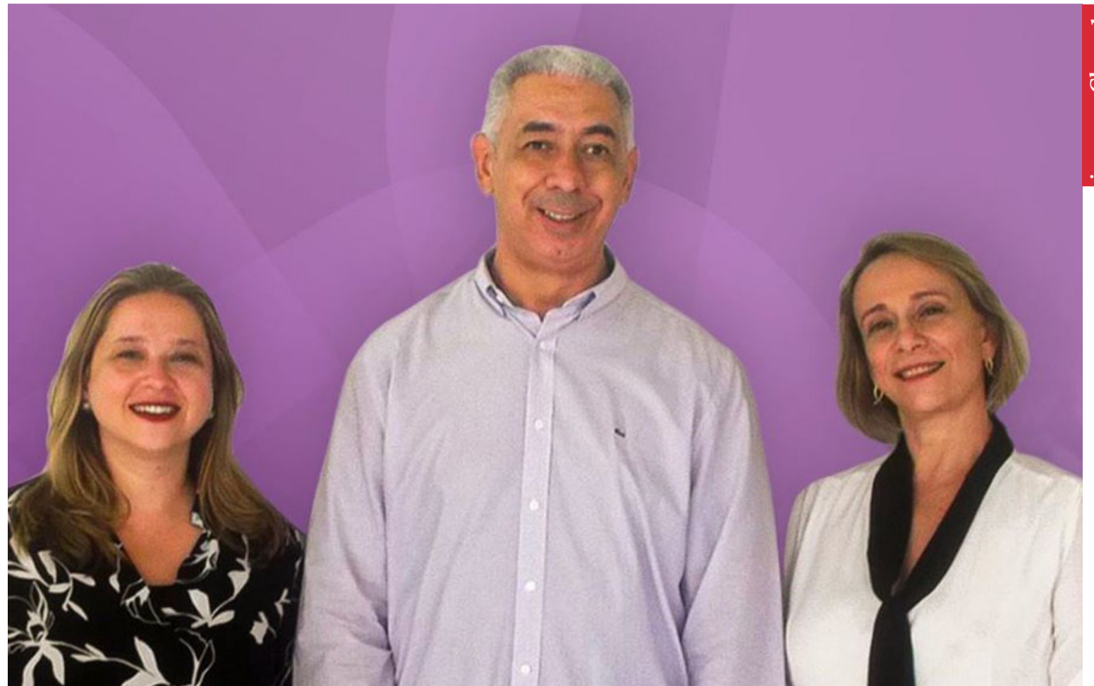
imagem: Chapa 1

Chapa 1 – Participar de forma protagonista nos órgãos colegiados de representação das Instituições federais e públicas de ensino superior, de forma a garantir a execução do or-