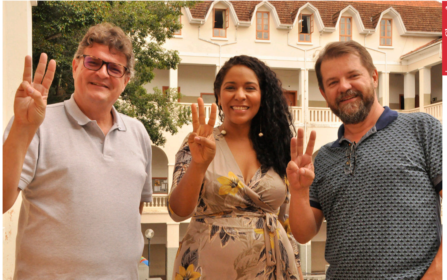
imagem: Chapa 3